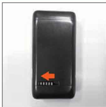
1. Сдвиньте влево защёлку крышки батарейного отсека