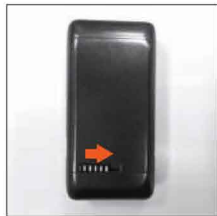
6. Сдвиньте защёлку вправо для блокировки крышки