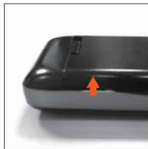
2. Откройте крышку батарейного отсека