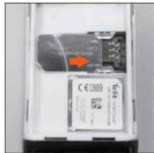
3. Вставьте SIM-карту контактами вниз, срезом назад