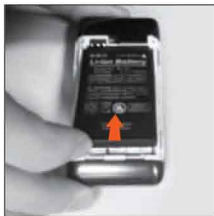
4. Вставьте аккумуляторную батарею