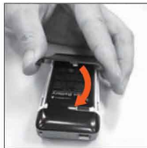
5. Закройте крышку батарейного отсека